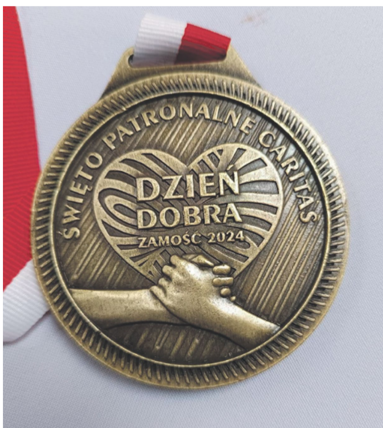
Złoty Medal Caritas