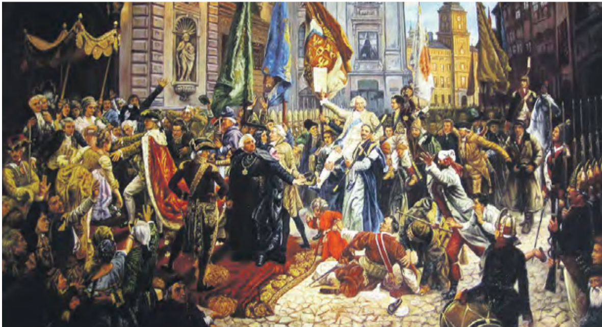
Obraz pt. „Konstytucja 3 Maja 1791”, Jan Matejko (źródło: Wikipedia)

Dokument regulował ustrój prawny Rzeczypospolitej, prze-