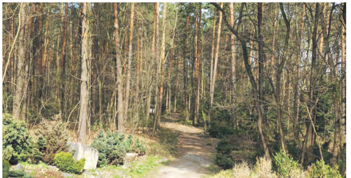
Zdjęcie poglądowe, Fot. Archiwum KRZ

Przede wszystkim są to murawy kserotermiczne i murawy ciepłolubne. Coś, co zawsze wzbudza dreszcz emocji wśród przyrodników, bo wiadomo, że takie miejsca pełne są zazwyczaj bardzo rzadkich roślin. I tak jest właśnie w tym przypadku. Przede wszystkim Borowa Góra jest jednym z nielicznych stanowisk w Polsce storczyka purpurowego. Jest to, moim zdaniem, jeden z najpiękniejszych storczyków polskich. Jego występowanie to jest dosłownie kilka, może kilkanaście miejsc w Polsce. I właśnie Borowa Góra jest miejscem, gdzie jest bardzo liczna populacja tego pięknego storczyka. Ale to nie wszystko. Występuje też storczyk kukawka, buławnik wielkokwiatowy ze storczyków, występują liczne gatunki zarazy, też niezwyklej rośliny,