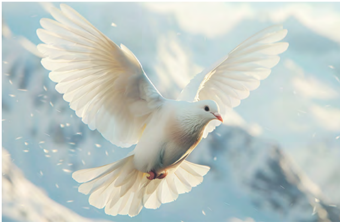
Gołębica - symbol Ducha św.

i zmartwychwstania Chrystusa wylanie Poczyciela na ludzkość nie dokonałoby się w sposób, jaki objawił się w dniu Pięćdziesiąticy. W mowie pożegnalnej Jezus zapowiada posłanie „innego Poczyciela” (por. J 14,16).