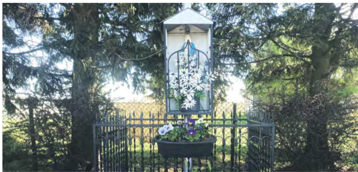
Przydrożna kapliczka, Steniatyn.

na pamięć. Dzieci przychodzą z ciekawości, młodszy trochę z obowiązku, trochę z sentymentu. I zaczyna się śpiew. „Chwalcie łąki umajone” niesie się ponad polami, odbija od przydrożnych drzew, czasem